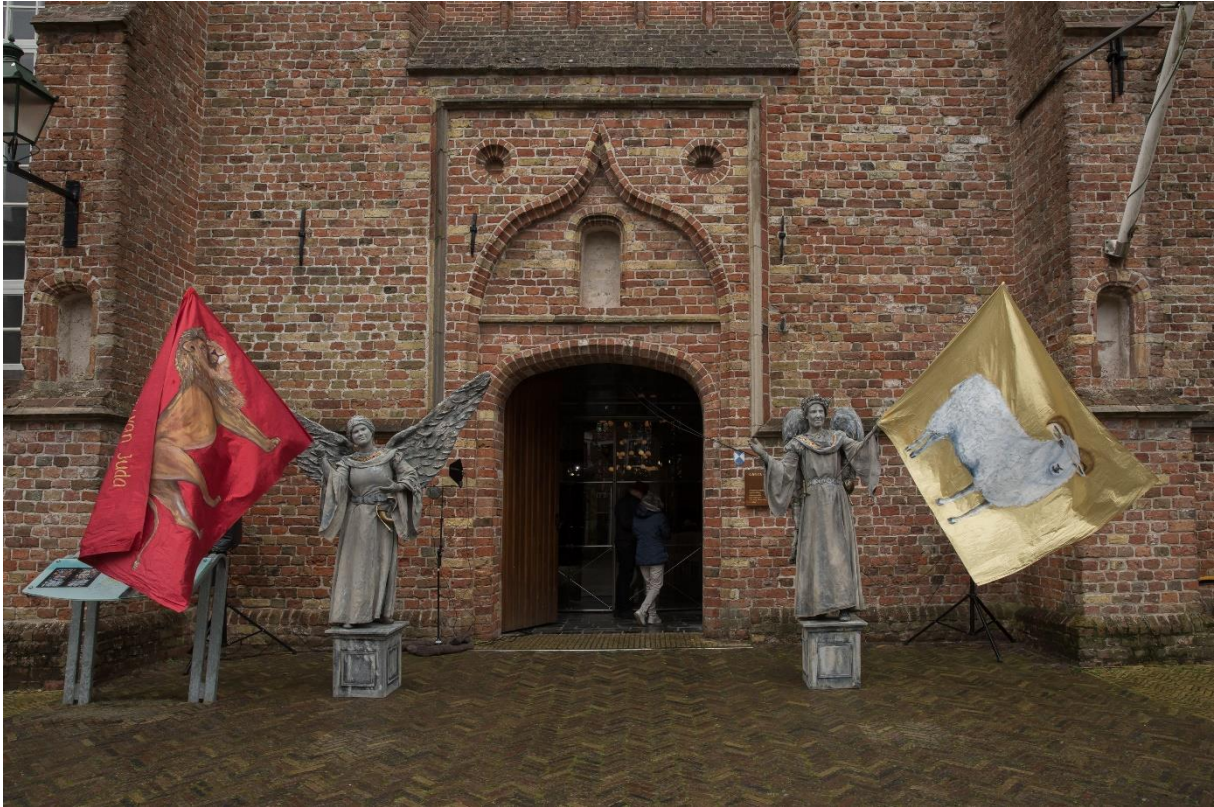
Bij de Grote kerk in Leeuwarden