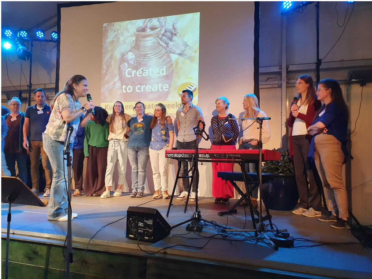
Het docenten team van het Theaterweekend