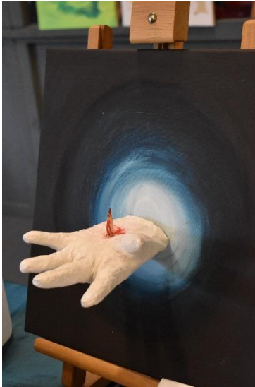
een eindwerkstuk van een jong meisje