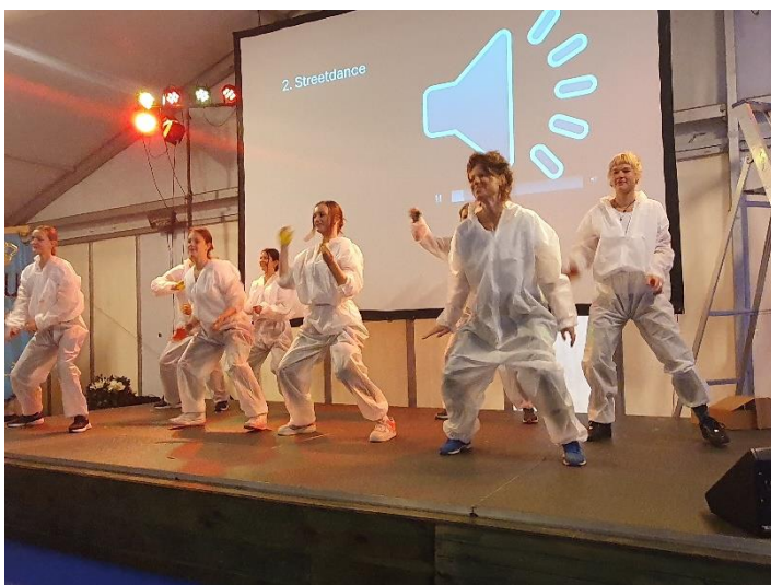
Hip hop klas