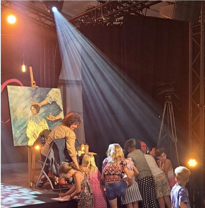
Schilderen in Heart 2 heart conferentie, waar kinderen mee wilden doen.