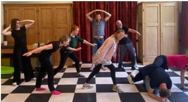
Theaterklas met tableau vivants