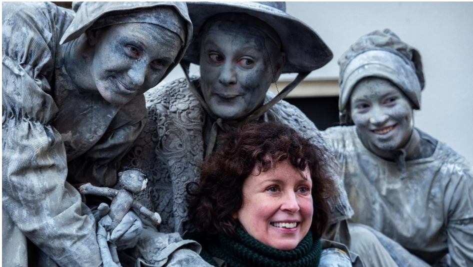
Tijdens het Dickens Festijn, optreden met Levende standbeelden.