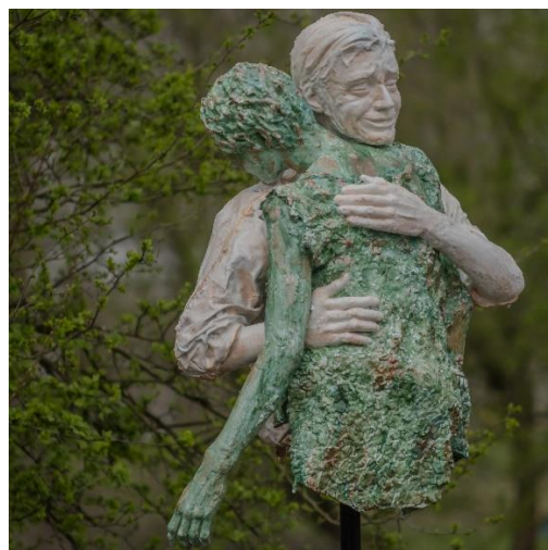
op de Floriade