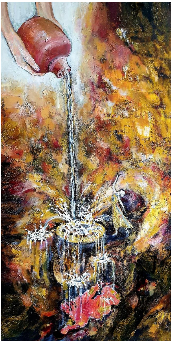
Schilderij door Carla. Fonteinen; Waar God creativiteit uitgiet en mensen dit opvangen, en waar er steeds nieuwe schalen komen die andere plekken in ons land bevoelen.

In dit seizoen zien we veel jongeren waarmee we samen hebben opgetrokken, zich ontwikkelen in creatieve bedieningen. Er zijn dansscholen opgezet, creatieve praktijken en kunstenaars die hun ondernemerschap inzetten in de gevangenis en op scholen. Dit zijn enkele voorbeelden om te tonen dat er groei en bloei is in de wereld van het christen kunstenaarschap.