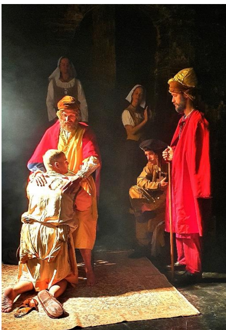
Onze replica van 'De verloren zoon' van Rembrandt

https://www.youtube.com/watch?v=1YbfRUlivS4