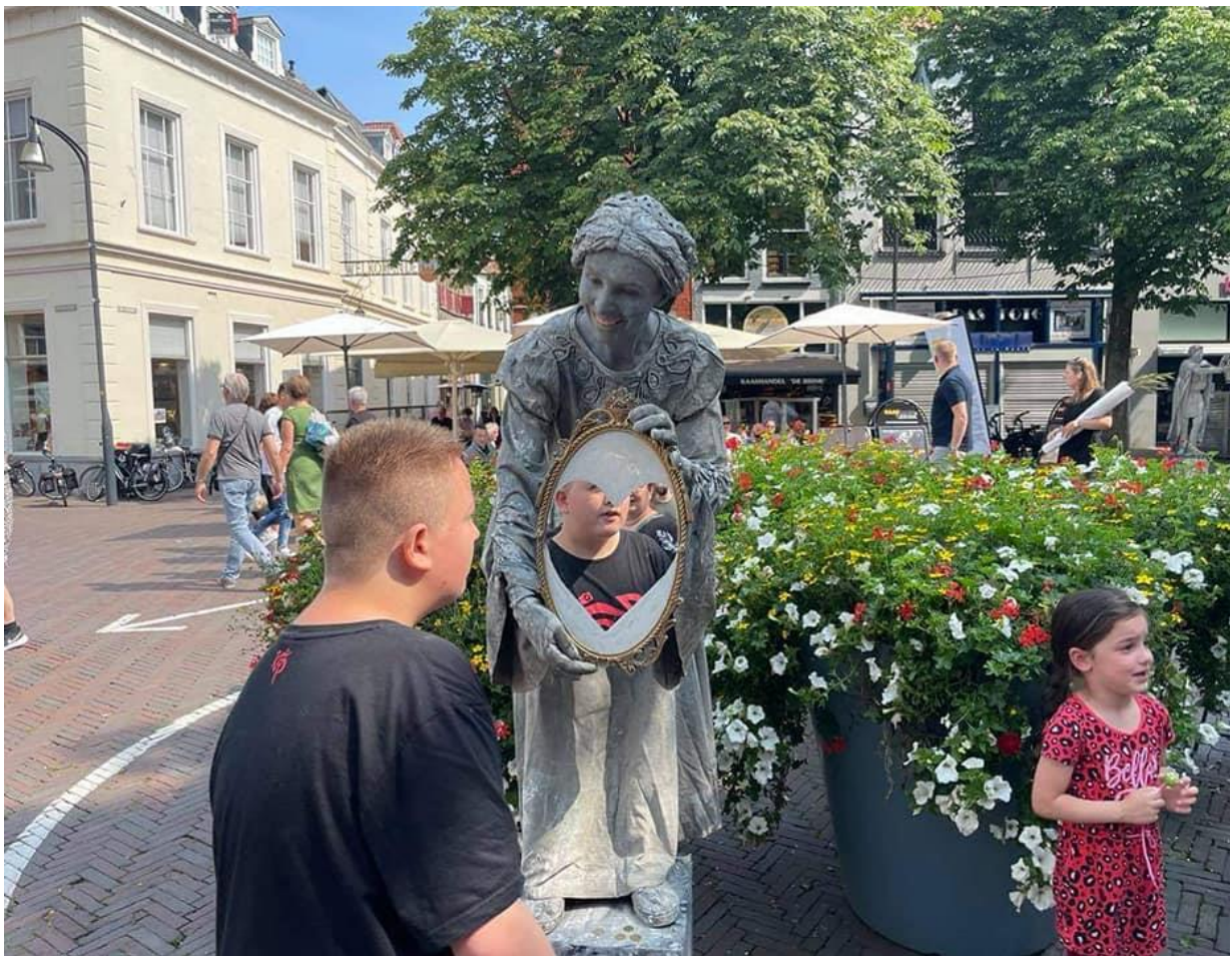
Het Levend standbeeld; Geliefd, op Moederdag 2021

Arts speaks, this world needs the amazing comfort and beauty of the arts..