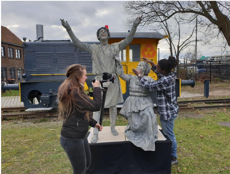
Verfilmen van 'De Beeldhouwer'.