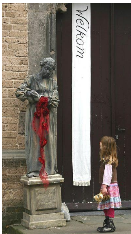
Levend standbeeld Wandeltheater Dolorosa

Arts Alive Versteegstraat 9 7425 CH Deventer