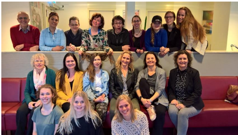
Docententeam Theaterweekend 2018

Voor volgend jaar voegen we de hoofdvakken fotografie, musical en beeldend 3 D toe.