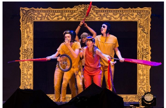
Optreden danstheater Home Run, op het jongeren terrein; "The Great Place", 20 mei