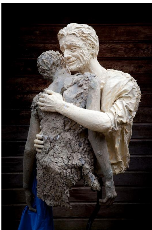
Sculptuur: Thuiskomen, door Carla Veldhuis

Where you slow down, to see things through different eyes, Breaking down the expected, to show new revelation, to see what is actually there.