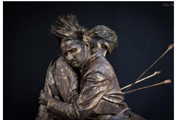
Heb je vijand lief. Brons beeld van Carla Veldhuis