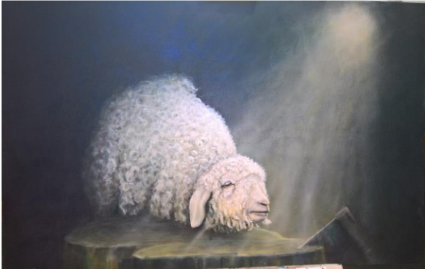
Het lam, Ineke van der Zwaag

Er deden 15 kunstenaars aan mee met kunstwerken die in een galerij werden geëxposeerd. Zowel sculpturen als schilderijen en torso's waren hier te bezichtigen.